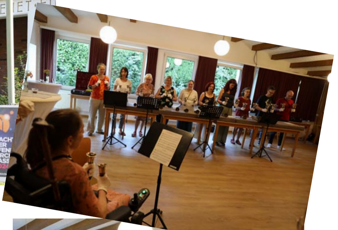
Nacht der offenen Kirchen im Juni