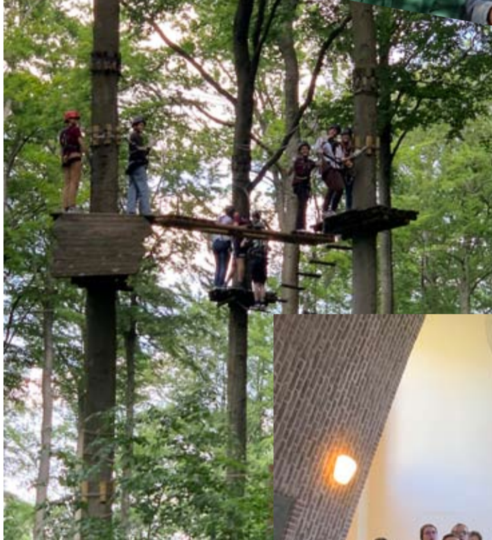
Action BJT im Juni