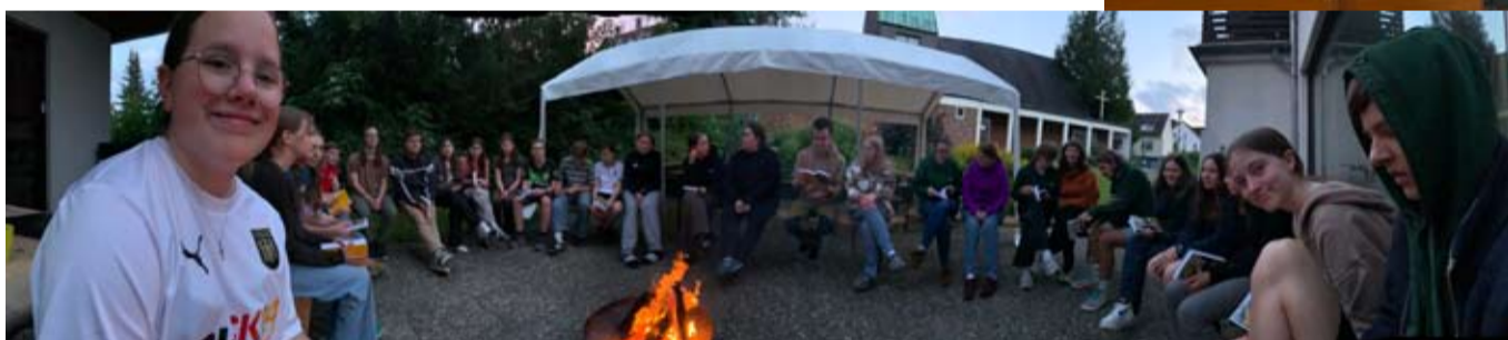
Mitarbeiterfest im Juni